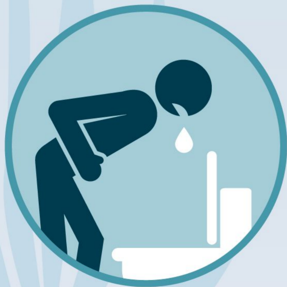
Pykinimas ir vėmimas