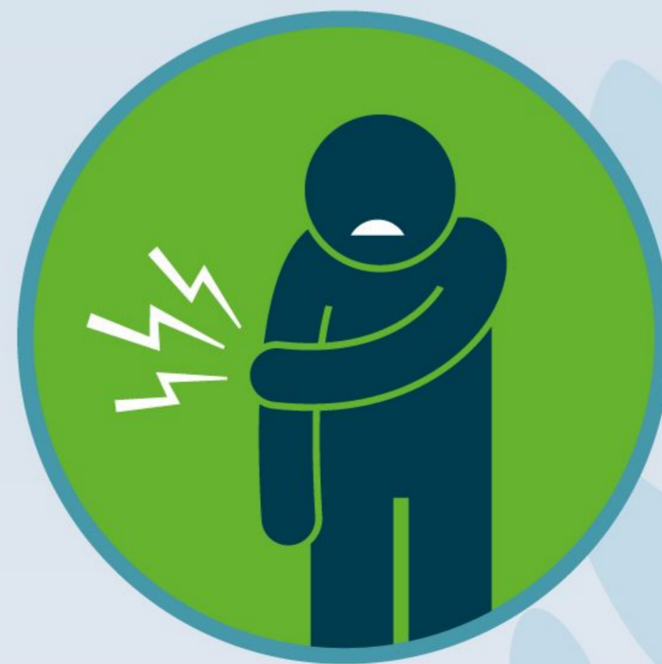
Raumenų / sąnarių skausmas